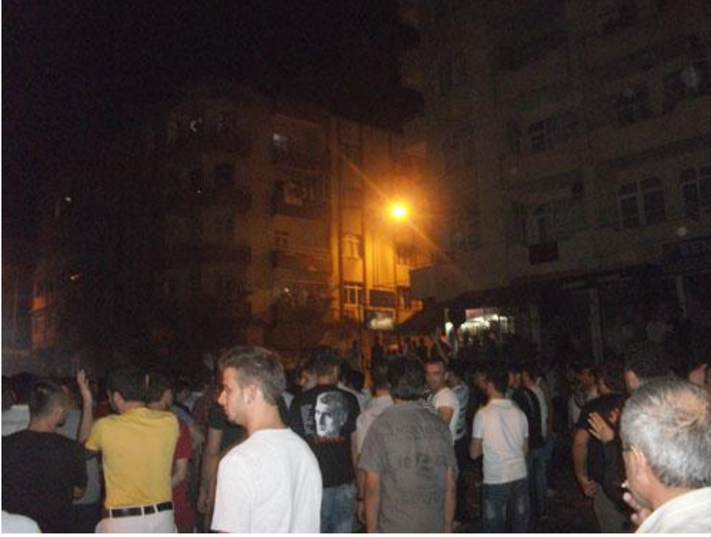
20.35 Armutlu'da polisin saldırısı sürüyor ve 5 bin kadar kişi polisin saldırılarına karşı direniyor.