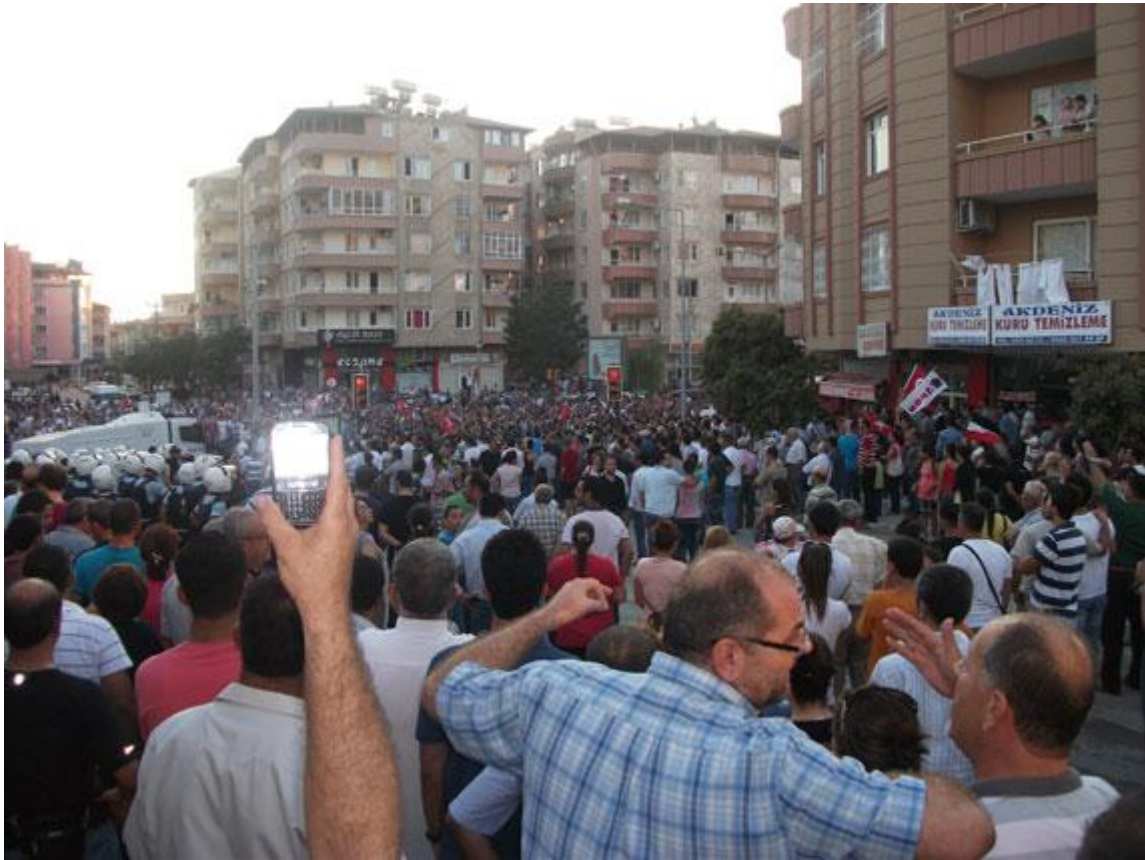
Antakya'da İşçi Partisi'nin düzenleyeceği Türkiye ve Suriye halklarının barışı ile ilgili miting Hatay Valisi tarafından yasaklandı. Valilik, mitingin yasaklandığını reklam panolarına ilan